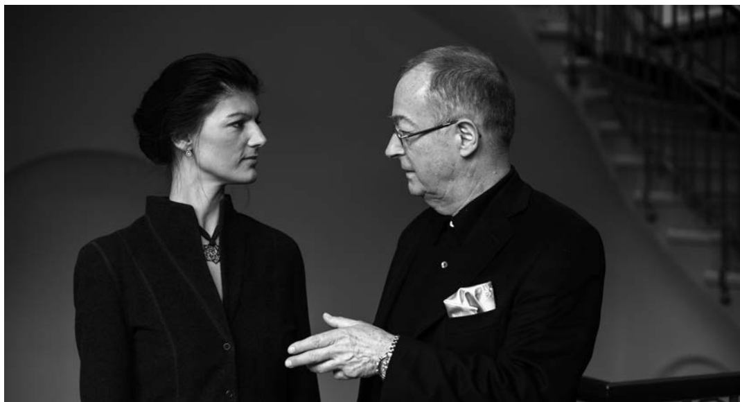
Frank A. Meyer im Gespräch mit Sahra Wagenknecht.

EU ist klagend- beleidigt die Rede. Soll sich die EU dafür bedanken, dass wir ihr erhabenstes Bürgergrundrecht zerknüllt und in den Papierkorb geworfen haben? Der Zürcher «Tages-Anzeiger» illustrierte die seltsame Schweizer Betrachtungsweise gleich mit zwei Karikaturen: Am 13. Februar war auf Seite eins zu sehen, wie die EU unserer züchtigen Helvetia den Hintern zeigt; am 18. Februar pinkelte – ebenfalls auf Seite eins – das Brüsseler Wahrzeichen Manneken Pis der Schweiz vor die Füsse. Respektloses Europa? Oder blickt die Schweiz verkehrt auf die Welt? Betrachten wir es doch einmal aus der Sicht der Europäischen Union: Helvetia zeigt ihr mit dem Volksentscheid vom 9. Februar den blanken Hintern; und es ist ein Schweizer Sennenknappe, welcher Brüssel vor die Füsse pinkelt. In Wahrheit ist es nicht eine kleine, brave Schweiz, die der grossen, bösen EU arglos in die Fänge geraten ist. Es ist die Schweizer Finanz-Grossmacht, es ist der Schweizer Steueroptimierungs-Standort, es ist die Schweizer Export-Grossmacht, die ihrerseits die europäischen Nachbarn herausfordert. Übt die Schweiz selbst die Milde, die sie von ihren Nachbarn erwartet? Kroatien wurde aus Bern eiskalt telefonisch beschieden, dass für seine Bürger freizügige Einwanderung in die Schweiz nicht mehr in Frage komme. Respekt für eine kleine Nation? «Was du nicht willst, das man dir tu, das füg auch keinem andern zu», lautet eine universal verständliche Volksweisheit. Ist es auch eine Schweizer Weisheit?