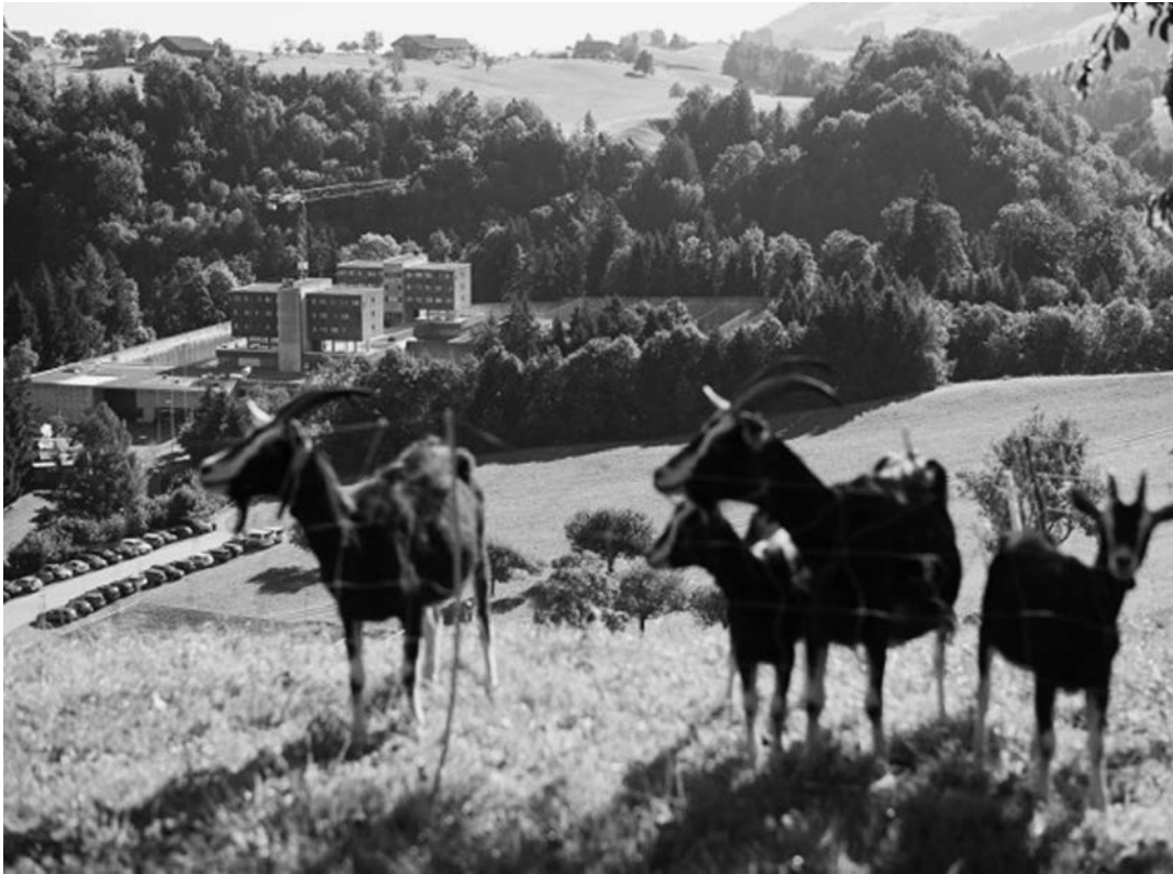
Die Strafanstalt Bostadel in Menzingen ZG.