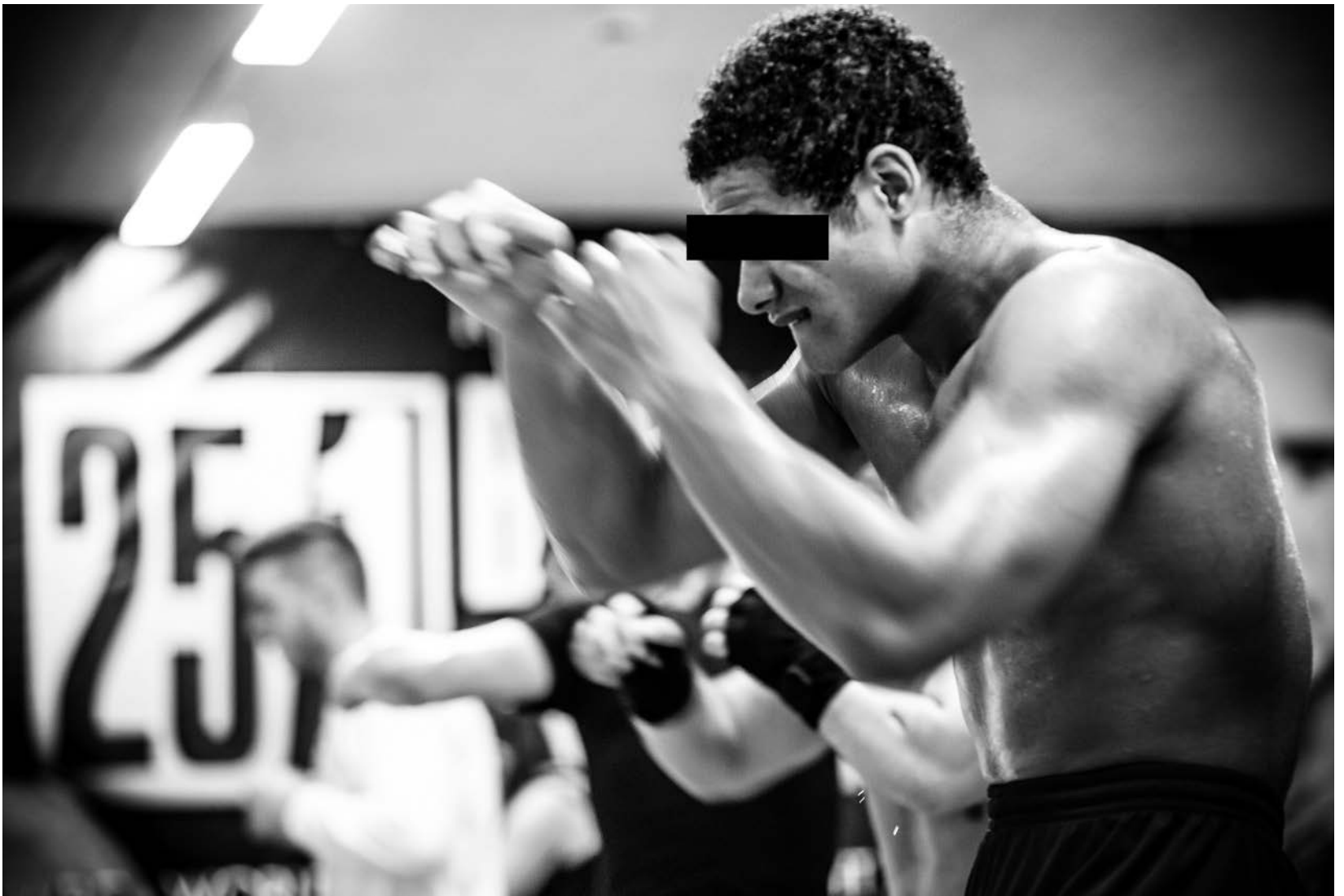
«Ich habe erst aus dem TV-Film erfahren, was mein Sondersetting kostet»: Jugendstraftäter «Carlos».