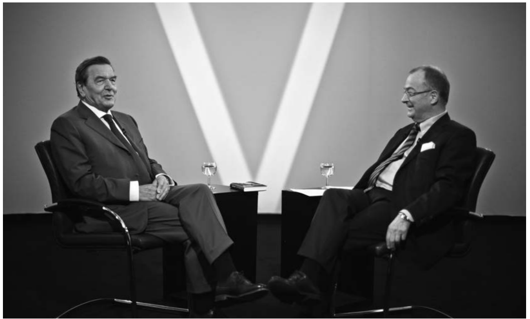
Frank A. Meyer im Gespräch mit Gerhard Schröder.

Sie haben ja darauf hingewiesen, dass man manchmal mit dem Rücken zur Wand steht. Dann ist man unduldsam. Ich habe gelegentlich zu wenig darauf gehört, was mir nahegebracht worden ist – von Mitarbeitern, durchaus auch von kritischen Medien. Wenn ich hier eine Schwäche eingestehen soll, dann die Tendenz, sehr schnell zu entscheiden. Damit sind gewisse Risiken verbunden, gar keine Frage! Ich bin natürlich beratungsfähig, bin es immer gewesen und bin es auch jetzt noch.